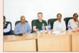
ताइवन के प्रो. शैलनट ग्रेग का महा. में आमंत्रित व्याख्यान