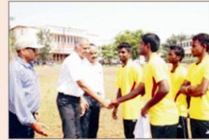
फुटबाल प्रतियोगिता के विजेता खिलाड़ियों से परिचय प्राप्त करते मुख्य अतिथि