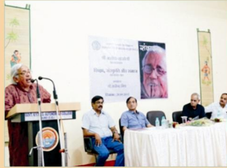
साहित्य अकादमी पुरस्कार विजेता प्रसिद्ध कवि श्री अशोक वाजपेयी का व्याख्यान