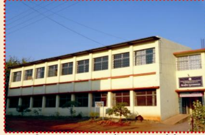
महाविद्यालय ग्रंथालय भवन में प्रथम तल पर समीनार हॉल एवं स्मार्ट क्लास रूम का निर्माण