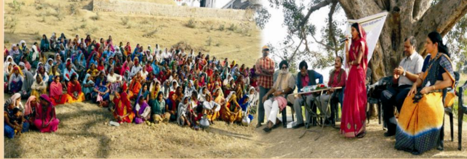
यूजीजी की विस्तार गतिविधि योजना के अंतर्गत महाविद्यालय के समाज शास्त्र विभाग द्वारा समीपस्थ ग्राम थनौद को गोद लेकर गाँव के सर्वांगीण विकास हेतु समुचित प्रयास किए जायेंगे इसी संदर्भ में ग्राम थनौद में आयोजित कार्यक्रम की झलक