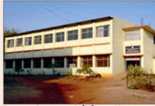
मुख्य ग्रंथालय एवं सेमीनार हॉल भवन