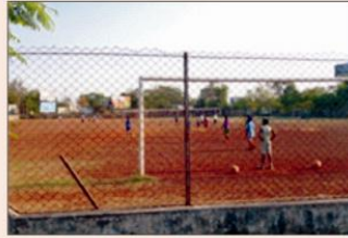
महाविद्यालय क्रीड़ा मैदान