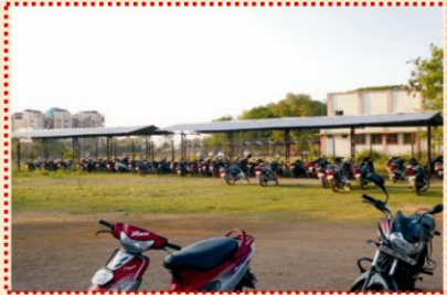
विद्यार्थियों हेतु वाहन पार्किंग शेड का निर्माण