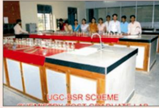
रसायन शास्त्र प्रयोगशाला