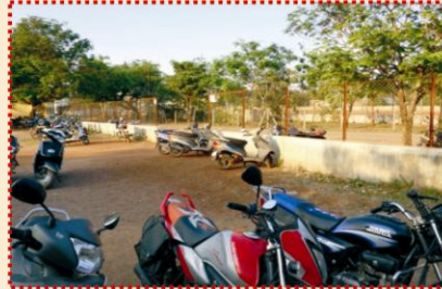
वाहन पार्किंग स्थल की सुरक्षा हेतु फेंसिंग कार्य पूर्ण