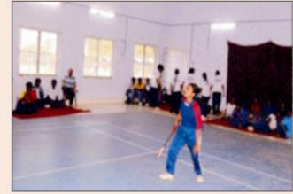
इन्डोर बैडमिन्टन हॉल