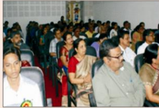
स्वामी विवेकानन्द हॉल