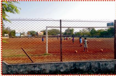
महाविद्यालय परिसर में खेल मैदान के फेंसिंग कार्य पूर्ण