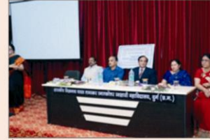
भौतिक एवं रसायन शास्त्र विभाग द्वारा संयुक्त रूप से आयोजित अंतर्राष्ट्रीय सेमिनार की झलक