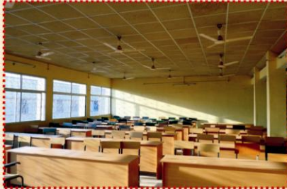
ग्रंथालय भवन के प्रथम तल पर स्मार्ट क्लास रूम का निर्माण