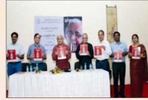
महाविद्यालय वार्षिक पत्रिका का विमोचन करते हुए प्रसिद्ध कवि श्री अशोक वाजपेयी