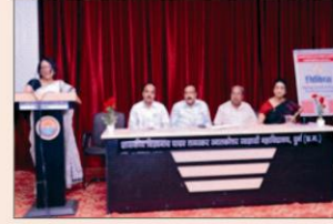
'त्रिविधा' कार्यशाला में उपस्थित अतिथि गण