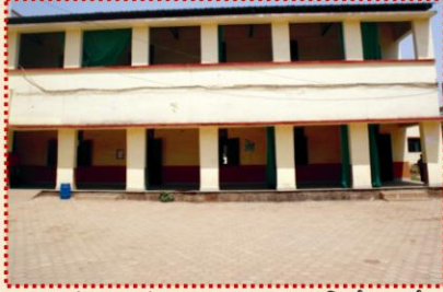
कक्ष क्र. 50 एवं 51 का प्रथम तल पर निर्माण कार्य