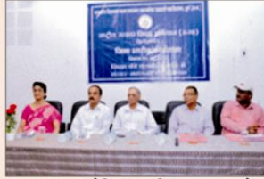
रूसा द्वारा प्रायोजित उच्चशिक्षा गुणवत्ता में मीडिया की भूमिका पर कार्यशाला