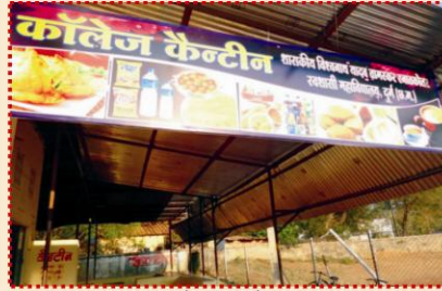
महाविद्यालय परिसर में केन्टीन में बैठक व्यवस्था का उन्नयन