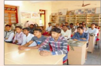
स्नातकोत्तर व्याख्यान कक्ष