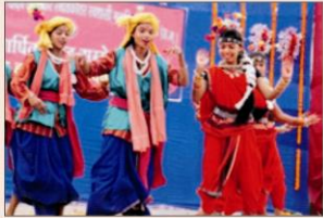
वार्षिक स्नेह सम्मेलन में छात्रों की प्रस्तुति