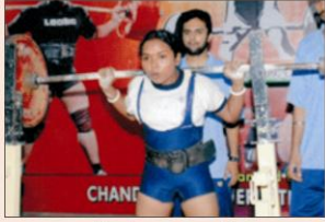
राज्य शासन के खेल पुरस्कार गुंडाधुर सम्मान प्राप्त महाविद्यालय की छात्रा