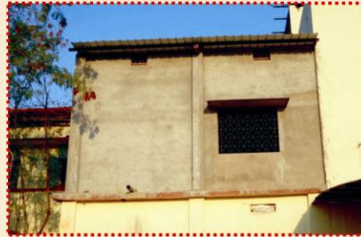
वनस्पति शास्त्र विभाग में प्रथम तल पर अतिरिक्त कक्ष का निर्माण