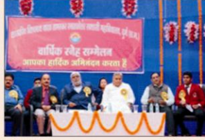
वार्षिक स्नेह सम्मेलन की झलक