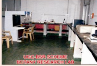
वनस्पति शास्त्र प्रयोगशाला