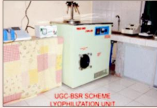
प्राणी शास्त्र प्रयोगशाला